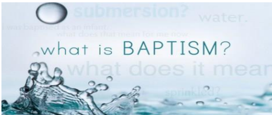
Bibelen er tydelig på at dåpen er et utvendig uttrykk for det arbeidet Jesus gjør på innsiden av oss.