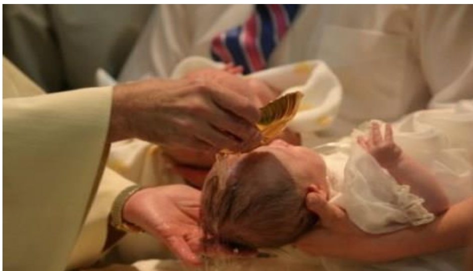
Selv om det er søtt og vakkert, er ikke barnedåp en bibelsk praksis.