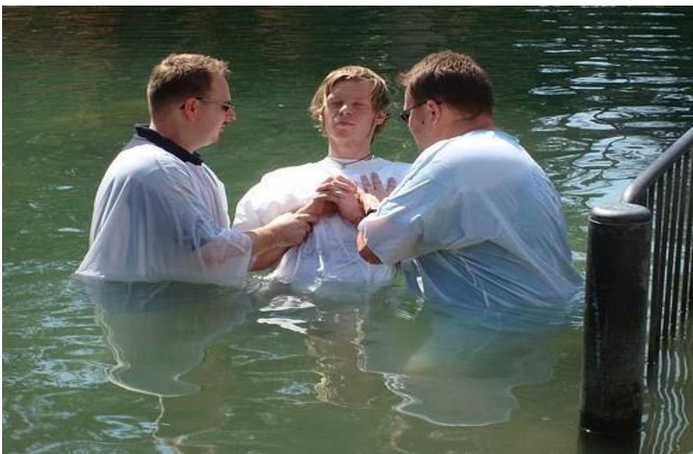
Slik Jesus gjorde for 2000 år siden, velger noen nye kristne å la seg døpe i Jordanelven.