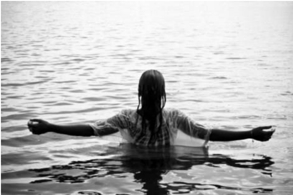
Dersom du er en gjenfødt kristen, bør du døpe deg og vise verden at du identifiserer deg med Jesus Kristus.

For av nåde er dere frelst, ved tro. Det er ikke deres eget verk, men Guds gave. Det hviler ikke på gjerninger, for at ingen skal skryte av seg selv. Efeserne 2:8-9)