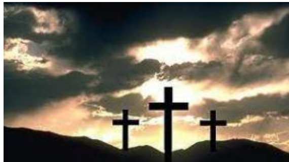
Røveren på korset fikk ikke mulighet til å bli døpt, men ble allikevel frelst.

Røveren som hang ved siden av Jesus, var naglet på hender og føtter. Det var helt umulig for ham å bevege seg, og selvsagt også umulig å la seg døpe. Allikevel ble han frelst: