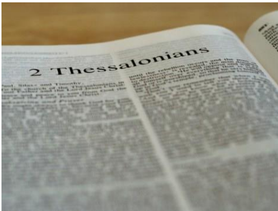
Det er viktig å forstå konteksten til 2.Tessaloniker

Det er alltid viktig å forstå konteksten når man skal studere en Bibeltekst. Paulus skrev veldig mye om endetiden. I det første brevet som Paulus skrev til menigheten i Tessaloniki forklarer han bortrykkelsen, endetidens samling av kirken, der både levende og døde skal møte Herren Jesus Kristus i skyene, og bli tatt med i trygghet før Den store trengsel setter inn: