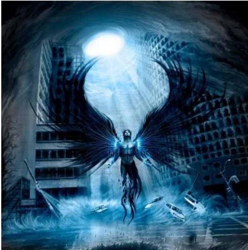
Da skal den lovløse åpenbare seg,...(2.Tessaloniker 2:8)

- Vil Antikrist stå fram før eller etter bortrykkelsen? En studie av 2.Tessaloniker kapittel 2 –